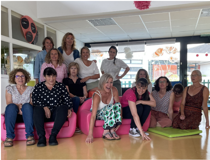
L'équipe du multi-accueil, prête à retrouver les enfants

Après une pause estivale, toute l'équipe de la Maison de la Petite Enfance est prête à retrouver les enfants pour cette nouvelle année. Pour rappel, la Maison de la Petite Enfance regroupe 3 structures : le multi-accueil, le relai petite enfance et la Protection Maternelle Infantile (PMI).