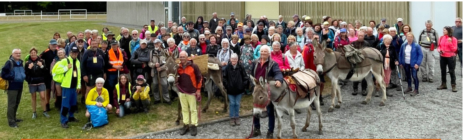
Lundi 8 juillet, la 3e étape de la Rando Tour a rassemblé 110 randonneurs et randonneuses qui ont parcouru une vingtaine de km à travers la campagne yffiniacaise, accompagnés des ânes de l'association "Les Amis aux grandes oreilles". Organisée par l'association Patrimoine et Découvertes, cette randonnée pédestre court sur 6 jours et fait le tour de l'agglomération briochine, entre terre et mer. La journée s'est terminée par une séance de relaxation au complexe sportif.