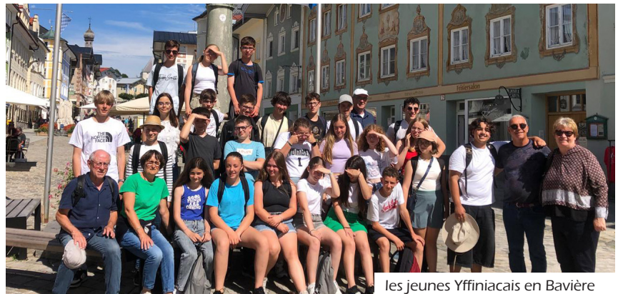
Les jeunes Yffiniacais en Bavière