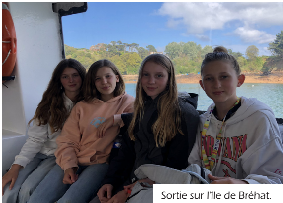
Sortie sur l'île de Bréhat.

En attendant, l'équipe en place fonctionne à merveille et a des projets plein la tête. Mais avant tout ça, ils se donnent rendez-vous le 21 septembre pour une soirée «Retrouvailles» afin de ne pas oublier trop vite ces bons moments passés !