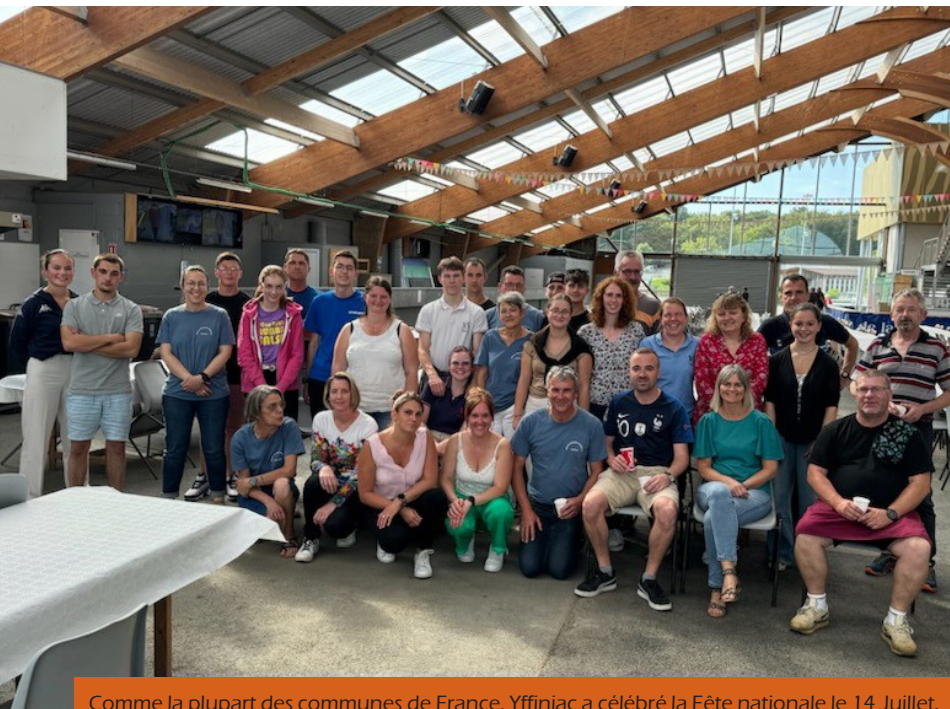
Comme la plupart des communes de France, Yffiniac a célébré la Fête nationale le 14 Juillet. À commencer par la cérémonie officielle au Monument aux morts le matin suivie de la très belle exposition des adhérentes d'Yffiniac Loisirs à la Chapelle Saint-Laurent, du moules-frites de l'Amicale des Employés Communaux avec près de 1000 couverts et du très beau feu d'artifice musical.