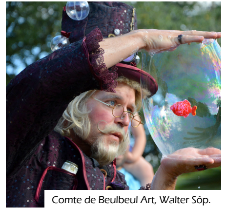
Comte de Beulbeul Art, Walter Söp.

1 atelier de 2 h pour les ados/adultes à 14h. Sur inscription.