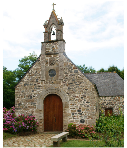
La chapelle Saint-Laurent constitue l'un des principaux patrimoines de la commune.