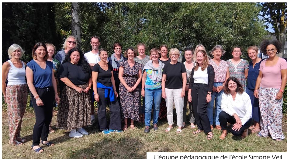
L'équipe pédagogique de l'école Simone Veil