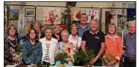
Les bénévoles de l'association accueillent chaque année les adhérentes d'Yffiniac Loisirs.