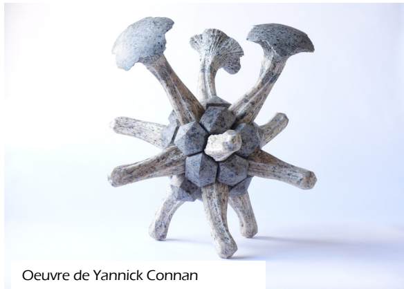
Oeuvre de Yannick Connan

Yannick Connan, artiste à l'origine des sculptures monumentales disposées dans le jardin de la médiathèque, revient exposer pour les 10 ans de la structure. Venez découvrir ou redécouvrir ses oeuvres du 14 septembre au 19 octobre.