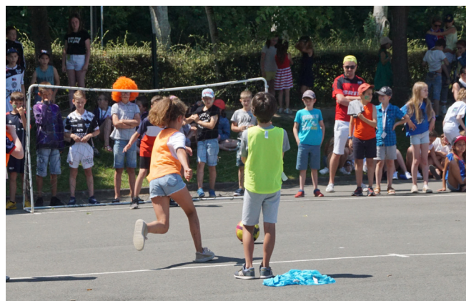
Les jeux rythment le temps du midi pour faire bouger nos enfants.

Pas moins de 42 agents sont mobilisés chaque jour pour accueillir les enfants sur la pause de midi, une vraie petite ruche. Au menu : plats équilibrés, repas à thème, aliments biologiques et locaux, lutte contre le gaspillage. Tous les ingrédients sont réunis pour une restauration écoresponsable en 2024-2025. En témoignage le renouvellement de notre label Territoire Bio engagé, obtenu en 2023, fort de nos 31,34% de produits bio.