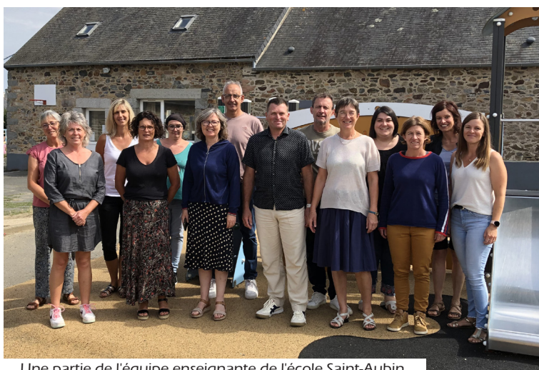
Une partie de l'équipe enseignante de l'école Saint-Aubin

Comme chaque année l'APEL a accueilli les parents le matin de la rentrée avec un café convivial afin de permettre les rencontres et de favoriser les échanges.