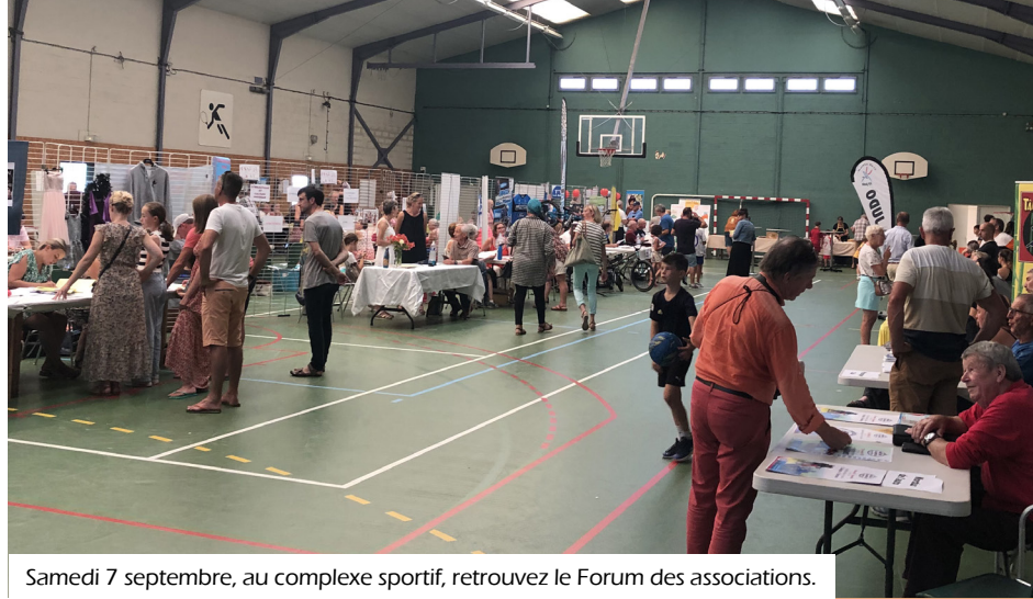
Samedi 7 septembre, au complexe sportif, retrouvez le Forum des associations.

Depuis le 1 er janvier 1999, tous les jeunes, garçons et filles de nationalité française qui ont atteint l'âge de 16 ans doivent obligatoirement se faire recenser à la mairie de leur domicile. Cette obligation légale est à effectuer dans les 3 mois qui suivent leur 16 e anniversaire. Il vous faudra vous munir du livret de famille et de votre carte d'identité.w