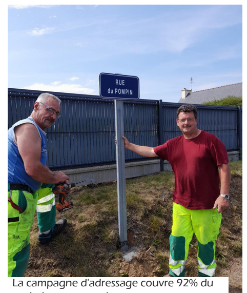
La campagne d'adressage couvre 92% du territoire communal.

Rappel : le service urbanisme est ouvert du lundi au vendredi de 8h30 à 12h, l'après-midi uniquement sur rendez-vous.