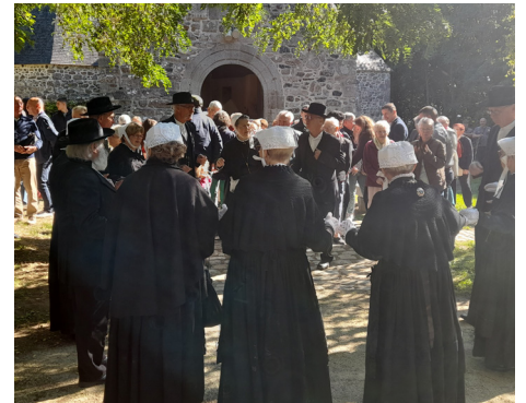
Les Balançières de la Baie lors du pardon en 2023