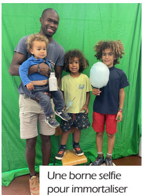
Une borne selfie pour immortaliser des moments mémorables de manière amusante.