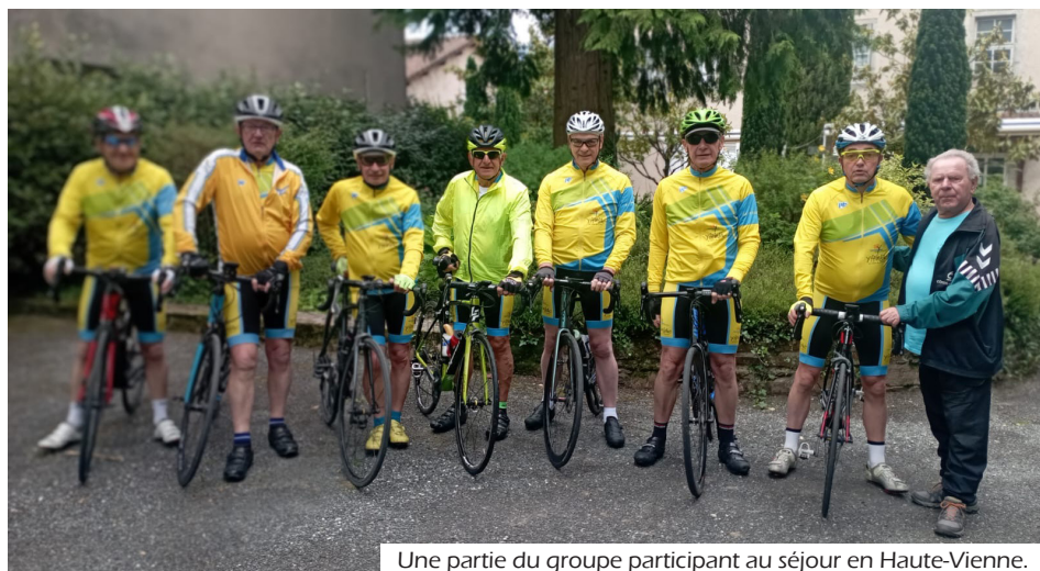
Une partie du groupe participant au séjour en Haute-Vienne.

L'association d'Yffiniac ne se limite pas aux frontières nationales. Cette année, quatre de ses licenciés ont participé à la Semaine Européenne de Cyclotourisme organisée au Portugal en juillet. Ces événements internationaux sont une opportunité unique de découvrir des paysages