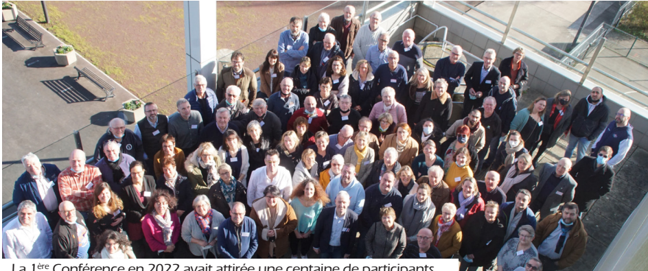
La 1 ère Conférence en 2022 avait attirée une centaine de participants.

Fidèle à son engagement en faveur du dynamisme associatif, la ville d'Yffiniac propose sa 2 e édition de la Conférence des Présidents. Cet événement se concentrera sur un enjeu majeur pour les associations : le recrutement et la mobilisation des bénévoles.