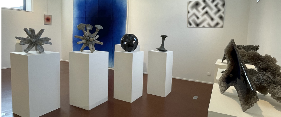
L'exposition " Les œuvres de Yannick Connan " sont visibles au Patio jusqu'au 19 octobre

Le PLUi, document qui définira les grandes orientations d'urbanisme pour les dix prochaines années, est actuellement soumis à enquête publique. Vous avez jusqu'au 30 octobre pour poser vos questions, donner votre avis, envoyer vos remarques... Le document est visible et consultable dans le hall de la mairie d'Yffiniac aux horaires d'ouvertures habituelles ou sur le site www.saintbrieuc-armor-agglo.bzh