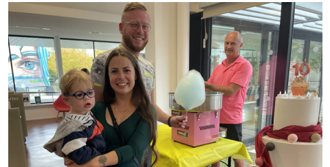
Ah, la barbe à papa, une friandise sucrée qui a fait le bonheur des petits et des grands.