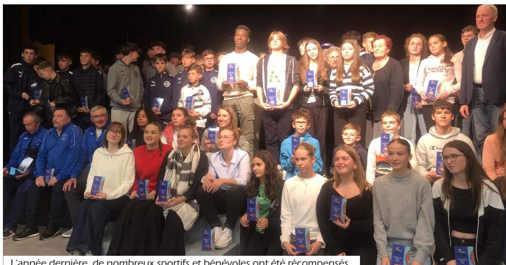
L'année dernière, de nombreux sportifs et bénévoles ont été récompensés.

seront récompensés. Outre les trophées et les applaudissements, la Cérémonie des Récompenses est avant tout un moment de convivialité, où la municipalité et ses associations se réunissent pour célébrer l'engagement et le succès. C'est une belle occasion de rappeler l'importance du bénévolat et du sport comme vecteurs d'épanouissement personnel et collectif.